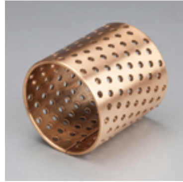
内外倒角 ID and OD chamfers